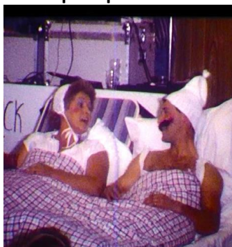
Een scene uit de film van 1992