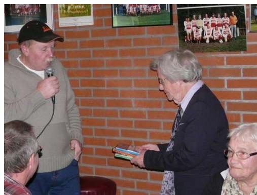
De voorzitter reikt de 1 e DVD uit.

Totaal zijn er meer dan 100 Dvd's verkocht.