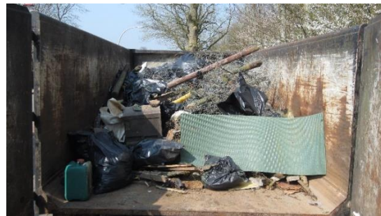
De container raakt al aardig vol.....