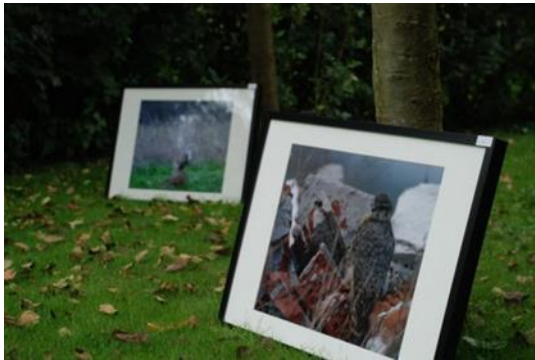
Overal is kunst te bewonderen, door het mooie weer zelfs in de tuin.

Op 7 september werd er een kunstroute Nieuw Scheemda- 't Waar gehouden. Galerie Waarkunst, restaurant De Verse Aarde, het Swieneparredies, het zomercafé Overal en Nergens (voormalig 't Schoevertje), de Witte Wolk, onze kerk, de drie molens en een groot aantal huizen gooiden hun deuren open. Er was van alles te zien en te horen; schilderijen, beelden, fotografie, keramiek, sieraden en kleding en muziek. Bijna 1000 mensen namen deel aan de route. De dag begon met het bezoek van RTV Noord radio. De Noordmannen brachten hun zondag uitzending vanuit Nieuw Scheemda – 't Waar. Een mooie uitzending werd gemaakt, zowel over de KIEK-route als over de dorpen Nieuw Scheemda – 't Waar. Het was een groot succes.