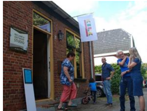
Neem een kijkje.....